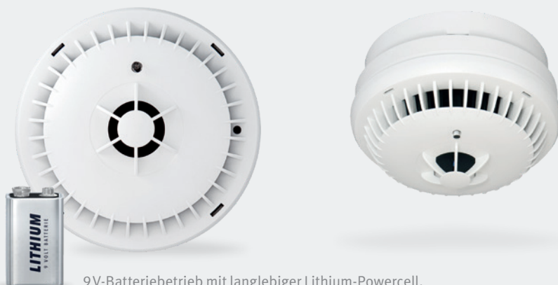
9V-Batteriebetrieb mit langlebiger Lithium-Powercell.

Ideal als Ergänzung zu Rauchwarnmeldern im Privatbereich.